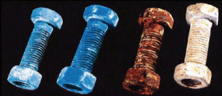
RILSAN WIS 4-52-03